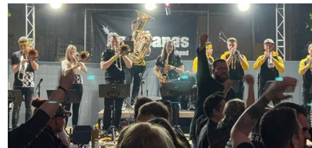
Für Partystimmung am Samstagabend sorgte Brassanas