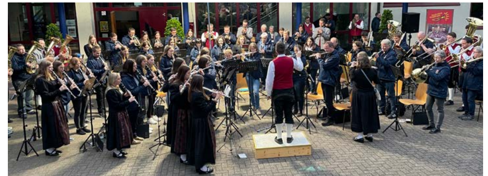
Fremdinger und Öflinger vereint beim Gesamtchor an der Freitagsserenade

Der Musikverein 1871 Fremdingen war bereits zum dritten Mal bei uns am Rettichfest zu Gast. Das Orchester ist über 150 Jahre alt und kommt aus dem Donau-Ries-Kreis. Ein Highlight des Vereins ist sein Blasius Musikfestival, wohin uns unser nächster Gegenbesuch führen wird.