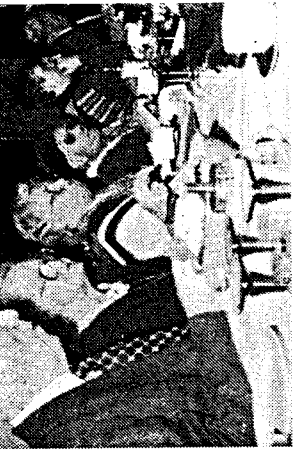
Einen gemütlichen Nachmittag verbrachten Altenwerks der Münsterpfarre im Katholischen

Danach blieben die Senioren und Gäste noch einige Zeit beisammen und freuten sich darüber, daß an die-sem Nachmittag sowohl für den Leib als auch für Geist und Seele gesorgt worden war.