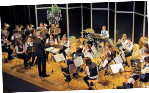
Die Jugendkapelle beim Neujahrsempfang der Service-Gemeinschaft und der Stadt Wehr.

Nach der Winterpause wieder richtig los gelegt haben wir ganz närrisch mit dem MVÖ-Forellenhof. Was das Hofbräu-Festzelt am Münchner Oktoberfest ist, sind wir mit unserem Forellenhof am Schällenmarkt: Gute Stimmung, vvviiiell Musik und natürlich nur das Beste für den Gaumen.