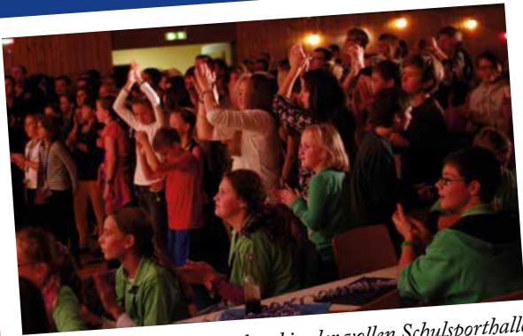
Party-Time am Samstagabend in der vollen Schulsporthalle