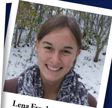
Lena Frank Flügelhorn SILBER

Öffnungszeiten Di. - Fr. 8.00 - 12.00 und 13.30 - 18.00 Uhr Sa. 7.30 - 14.00 Uhr Dienstags und Donnerstags abend nach Vereinbarung